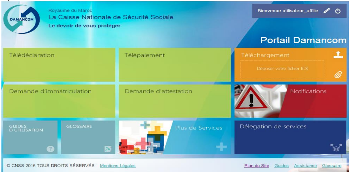
Figure 2 : Menu principal de l'espace Affilié

Après authentification, l'utilisateur accède à l'écran d'accueil suivant :