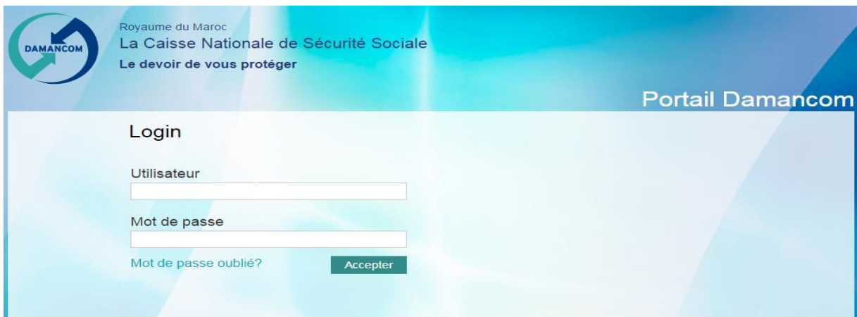
Figure 1 : Authentification à l'espace Affilié

L'authentification à l'espace privé du portail DAMANCOM, requiert 2 niveaux sécurisés. Le premier consiste à sélectionner le certificat numérique déjà installé et introduire dans un 2 ème niveau le login et mot de passe.